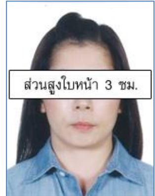
ส่วนสูงใบหน้า 3 ซม.

บัตรนักเรียน ไม่ว่าเป็นช่วงปิดเทอมและ ต้องมีอายุ 1 เดือนก่อนยื่นวีซ่า ) ต้องสะกดชื่อ-สกุล ให้ตรงตามหน้าพาสปอร์ต